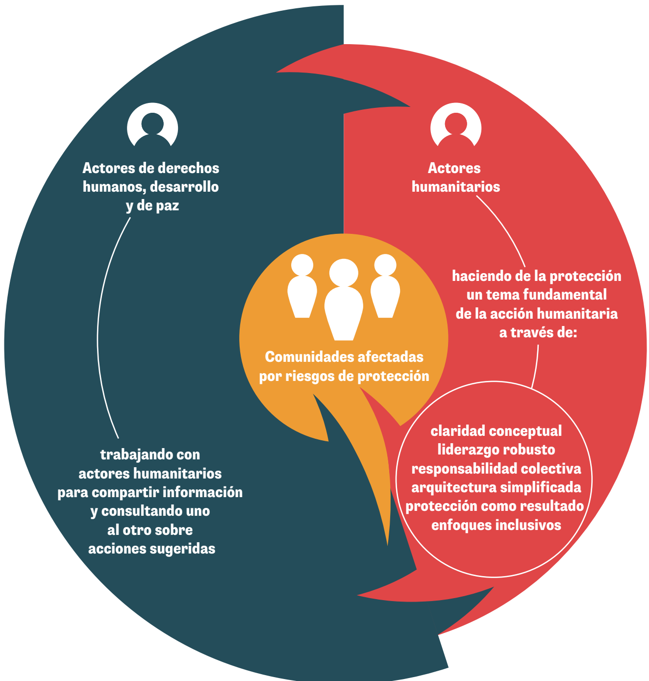
Figura 2 Visión de la política de protección del IASC sobre los enfoques colectivos para reducir los riesgos

Los problemas de protección son muy variados y no pueden resolverse sólo mediante los agentes humanitarios. Para reducir los riesgos, es fundamental crear un entendimiento mutuo y una responsabilidad colectiva con los actores que trabajan en el sistema humanitario, así como junto a él (Figura 2).