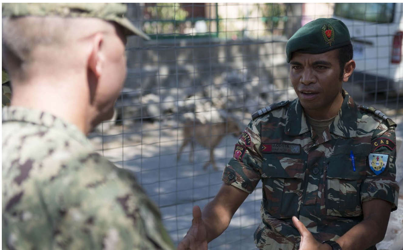
Membru ida husi Forsa Defeza Timor nian.