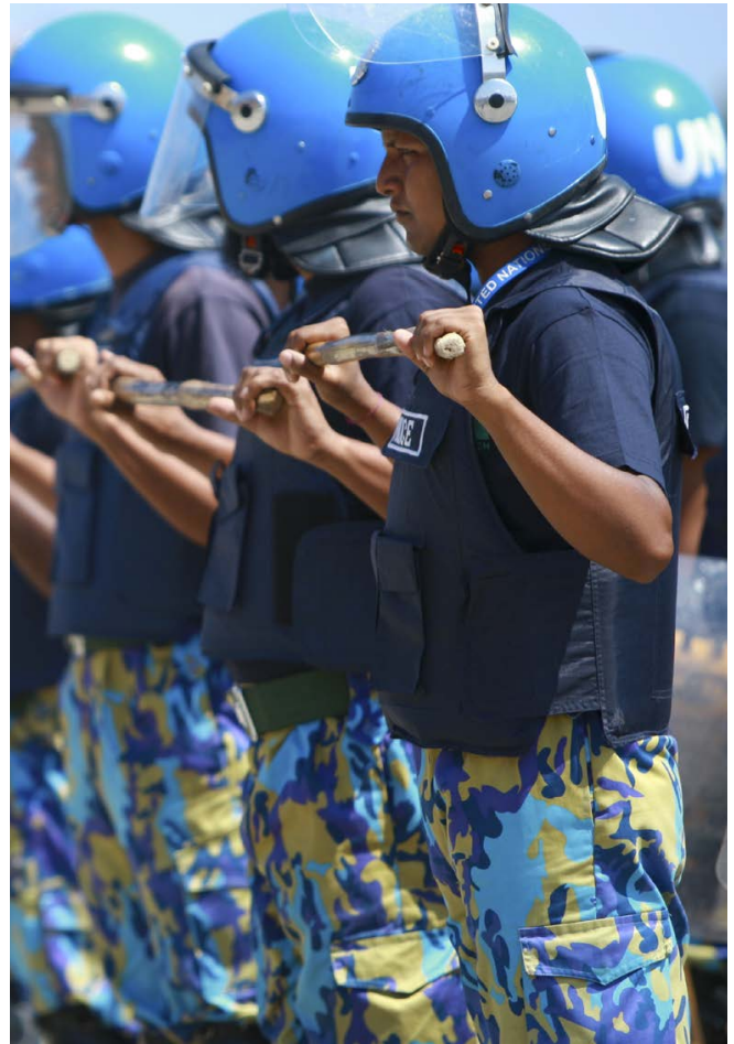
Treinamentu ONU no polisia nasional.

Timor-Leste sai ona uma na'in ba misaun ONU lima no intervensaun manutensaun paz internacional la'os ONU nian rua, ho fundus ba manutensaun paz ho total liu bilaun $3.2 no assistensia dezvoltimentu to'o bilaun $4.2 iha tinan 1999-2012. 3 Forsa Internasional ba Timor-Leste (INTERFET), ne'ebé hatun hodi hapara violénsia depois referendu 1999, ne'e jeralmente konsidera nu'udar susesu ida, liu-liu wainhira forsa sira ne'e obriga milisias Indonezia nian sai ba Timor Osidental (Wassell, 2014: ii). Nomós, levantamentu ida iha tinan 2011 hatudu katak, porsentu 63% husi rezidente sira iha Dili sente katak Forsa Estabilizasaun Internasional (ISF) no Polisia ONU ne'ebé